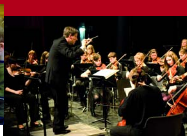
VERANSTALTUNGEN »INSTRUMENTE PUR« SONNTAG 14. MÄRZ 2010