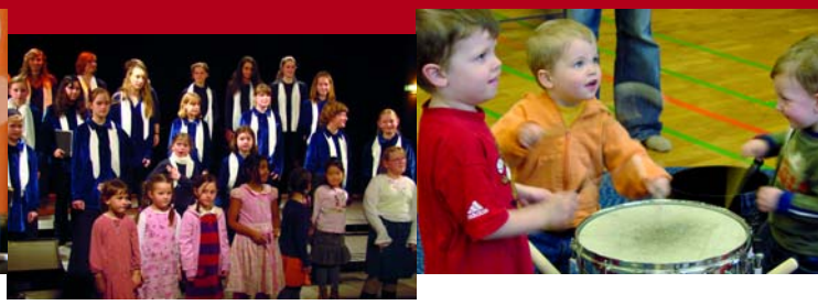
VERANSTALTUNGEN »INSTRUMENTE PUR« SONNTAG 14. MÄRZ 2010